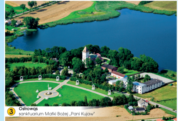
3 Ostrowąs sanktuarium Matki Bożej „Pani Kujaw”

Certyfikat Euro Renoma 2015 European Register of Reputables