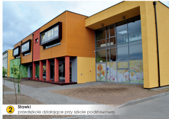
2 Stawki przedszkole działające przy szkole podstawowej