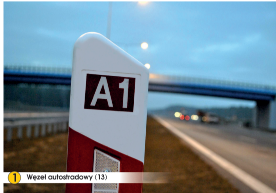
1 Wzrost autostrady (13)